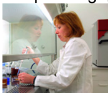
Fundamenteel onderzoek / onderzoeksinstellingen